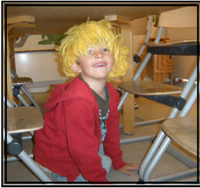
Loke klæder sig ud og laver sjov i dukkekrogen.

"Bag enhver frustration gemmer sig en vindfriet drøm - og drømmen kom først."