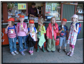
Uhm det er godt med en lækker is